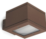
Milan Wall down