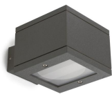
Milan W Up-down